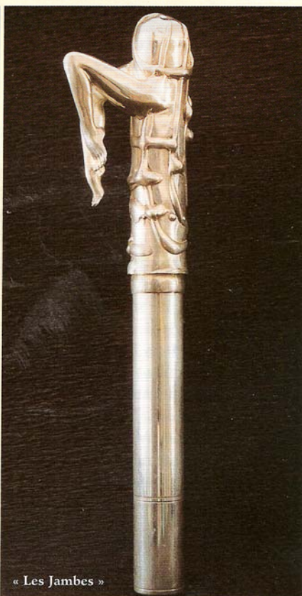
« Les Jambes »