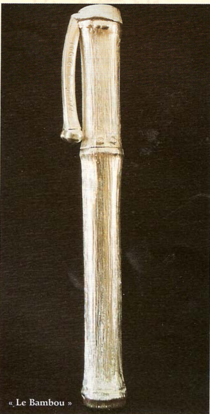
« Le Bambou »