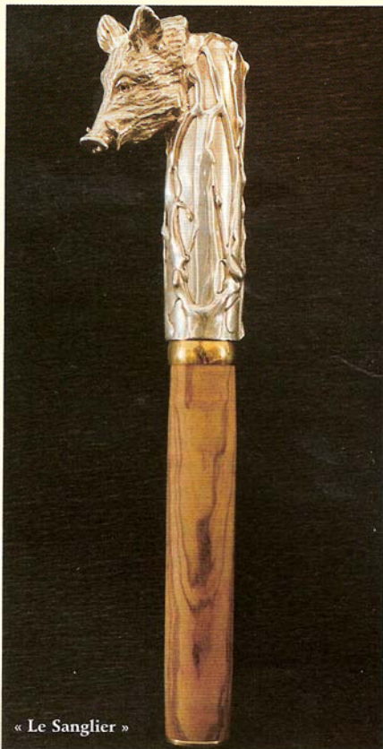
« Le Sanglier »

Fortuné ou en voie de l'être, ce nouveau Calder au look post-soixante-huitard garde en tout cas les pieds sur terre... et des plaisirs au goût de terroir, comme si, à force de fréquenter les grands de ce monde, il lui fallait rester enraciné dans la vraie vie, après avoir connu tant et tant de gens hors normes, aussi blasés que fortunés. « On se lasse vite de jouer les fous du roi, d'autant plus que ce sont les rois, les plus fous. Il n'est de vraie richesse qu'humaine. Ce qui me plaît, c'est de boire un coup avec mes vigneronns, de vendanger ma vigne et de me faire une bonne bouffe aux Hautes-Roches où à la Cave Martin. Ou encore de descendre la Loire, comme je le fais chaque été. » Sans même de Bic. ■