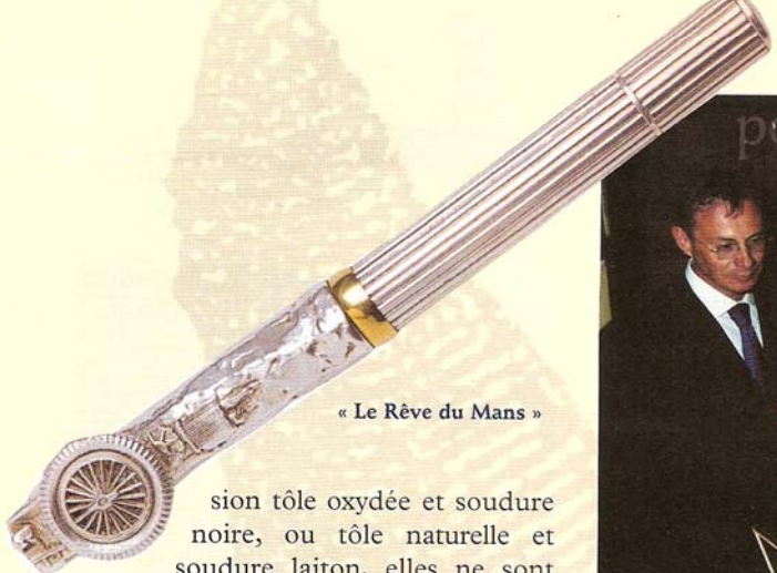
« Le Rêve du Mans »

sion tôle oxydée et soudure noire, ou tôle naturelle et soudure laiton, elles ne sont pour chaque modèle produites qu'à douze exemplaires. De la série (très) limitée qui concerne aussi ses autres œuvres « domestiques » que sont tables basses, chaises et vitrines murales.